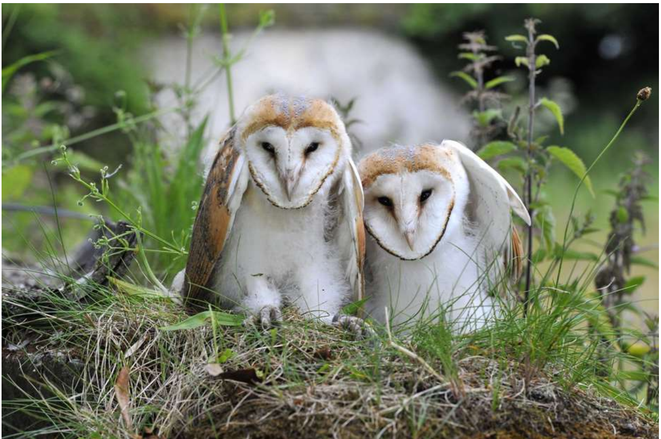
Tionscadal Scréachóg Reilige Chill Mhantáin (Féach Aguisín 2 chun teacht ar shonraí faoin tionscadal seo agus tionscadail oidhreachta eile roimhe seo)