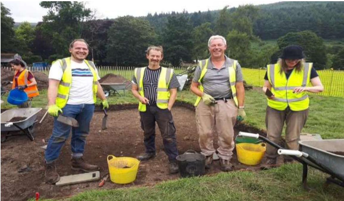
Fóram Oidhreachta Ghleann Dá Loch

Léirthuisicint ar shaibhreas oidhreacht Chill Mhantáin a mhéadú trí fhiosracht a spreagadh, rochtain do chách a fheabhsú agus tuilleadh deiseanna a sholáthar do dhaoine aghaidh a thabhairt ar an oidhreacht ar bhealaí nua agus nuálacha.