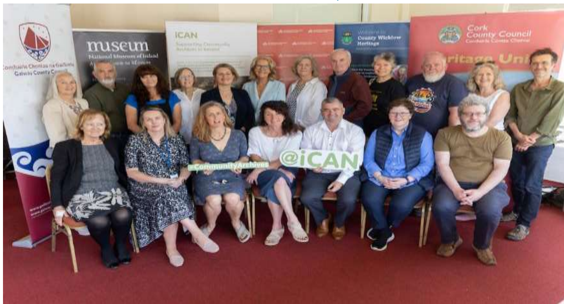
Líonra Cartlainne Pobail na hÉireann, ICAN

(Féach Aguisín 2 chun teacht ar shonraí faoin tionscadal seo agus tionscadail oidhreachta eile roimhe seo)